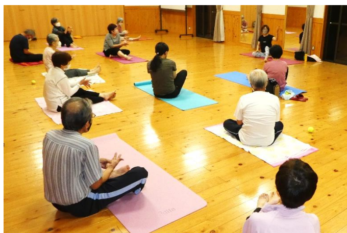
ヨガマットを使っでの実習