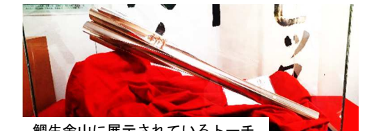
鯛生金山に展示されているトーチ