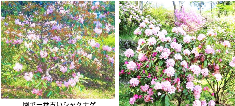
園で一番古いシャクナゲ

上津江シャクナゲ園(程野)のシャクナゲやツツジがきれいに咲きました。今年も桜と同様、例年より半月ほど、開花が早かったみたいです。