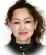
梶原 紀子 農業 住宅 観光