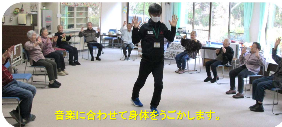
音楽に合わせて身体をうごかします。

最後になりましたが、皆様方のご健勝とご活躍を祈念いたしまして、年頭のご挨拶といたします。