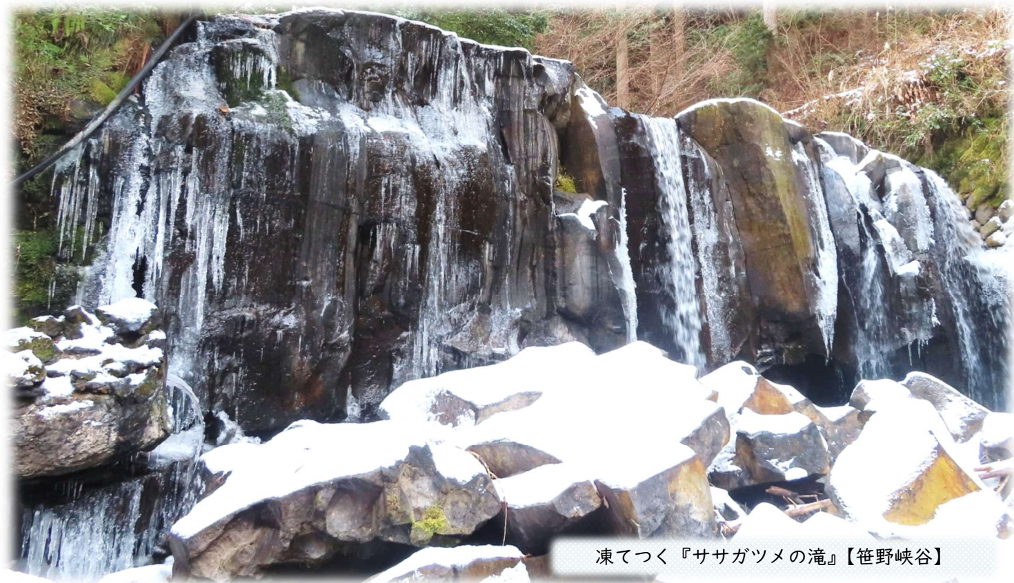
凍てつく『ササガツメの滝』【笹野峡谷】