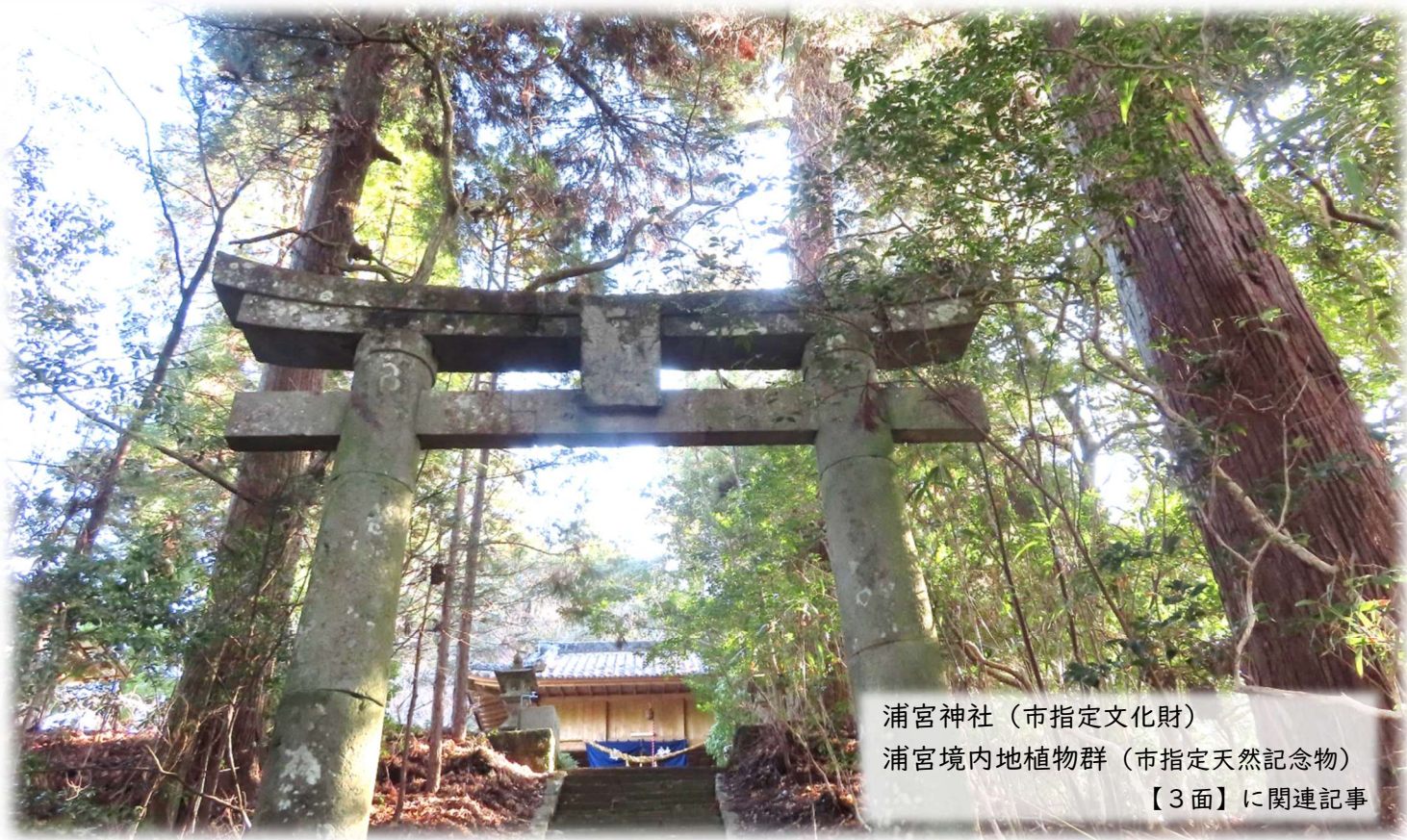
浦宮神社（市指定文化財）