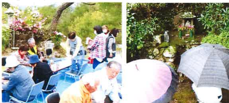
馬頭観音さまのお祭り

白草地区で4月18日(月)に馬頭観音さま、21日(木)に御大師さまのお祭りが行われました。地区の方々が集まる大切な機会です。