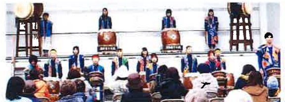
昨年度の上津江産業文化祭・酒呑童子太鼓(津江っ子太鼓)