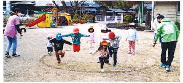
昨年度のせいま先生のこども園体操教室