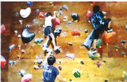
昨年度の 津江っ子チャレンジクラブ ボルダリング体験