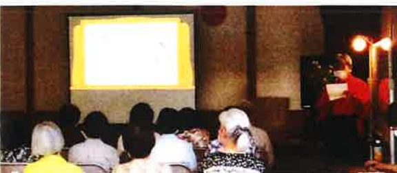
昨年度のたかさご学級・紙芝居の様子