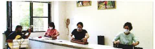
昨年度の自主学習教室・キーボードとクラシックギターの合同練習