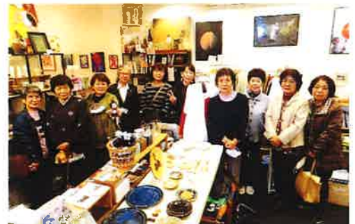
昨年度の 女性セミナー・バス研修 リベルテ日田にて