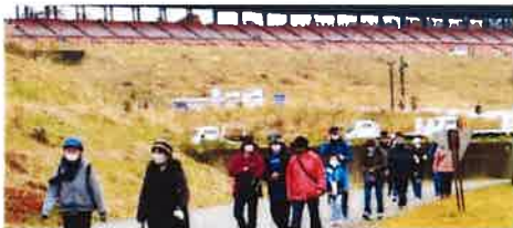
昨年度のウォーキング大会(オートポリス)↑ と女性団体交流会(白草公民館)↓