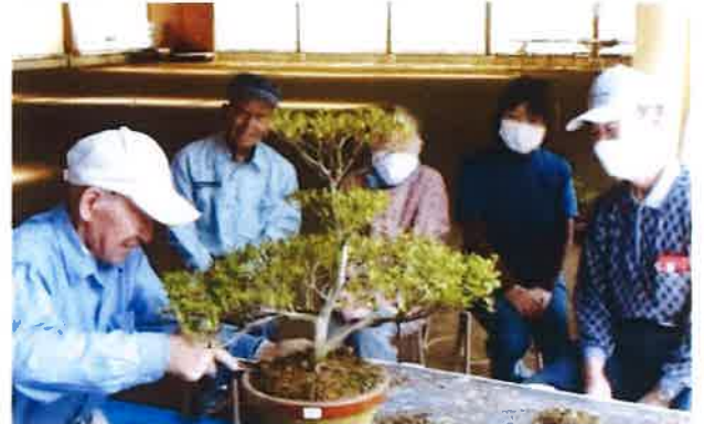
令和4年度 上津江公民館運営委員会 委員

開花状況や期間は、公民館のホームページや町内放送でもお知らせいたしますのでご確認ください。期間中は自由にご覧いただけます。皆さんのご来場お待ちしております!!