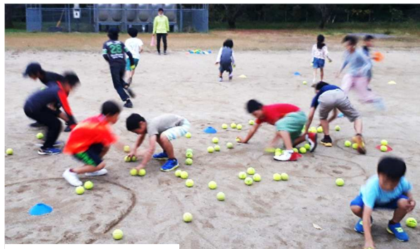
津江小学校体操教室

作戦を立ててボールを集める遊びなど、体と頭を使ったゲームで、子ども達は熱中して楽しんでいました。