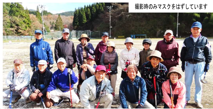
撮影時のみマスクをはずしています