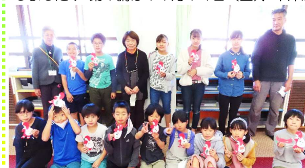
出来上がった作品を持って（記念撮影時のみマスクをはずしています）

津江っ子チャレンジクラブ（津江小4～6年生対象）がスタートしました！第1講は11月14日（土）、中津江公民館で実施。