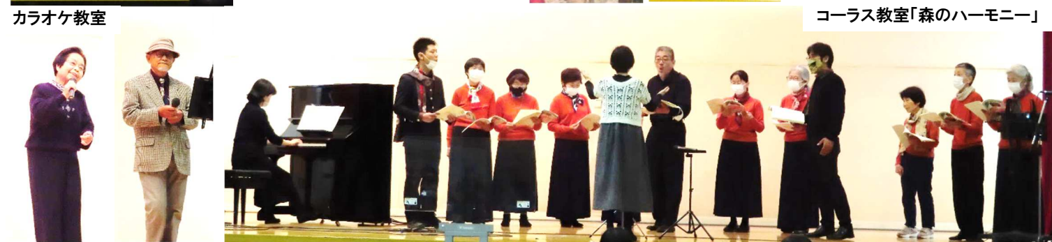
フェスティバルにおける歌唱を伴う発表は、マスクの着用又は飛沫防止パーテーションを使用しています。