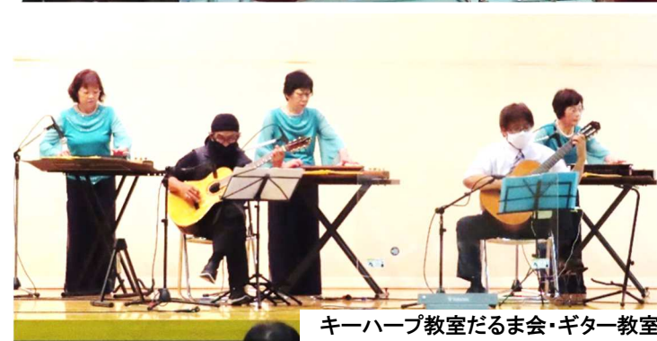
キーハープ教室だるま会・ギター教室