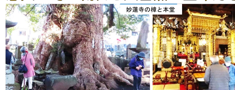
妙蓮寺の樟と本堂