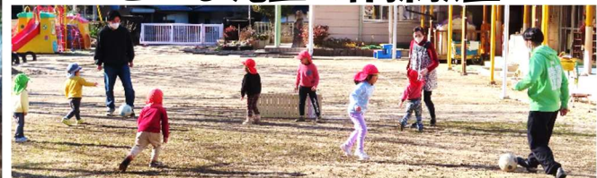
こども園↑(会場は中津江保育園)と津江小学校↓