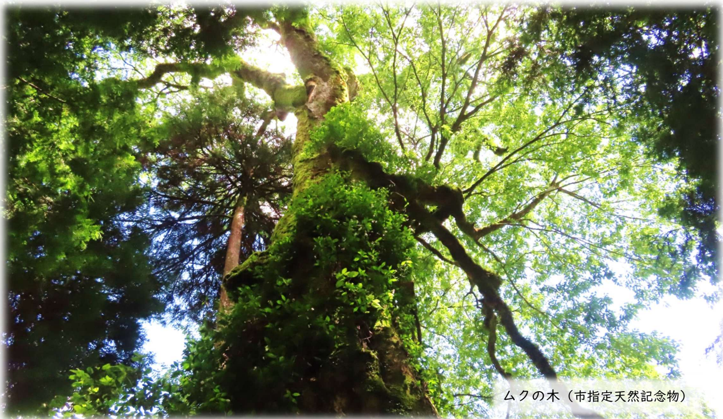
ムクの木（市指定天然記念物）