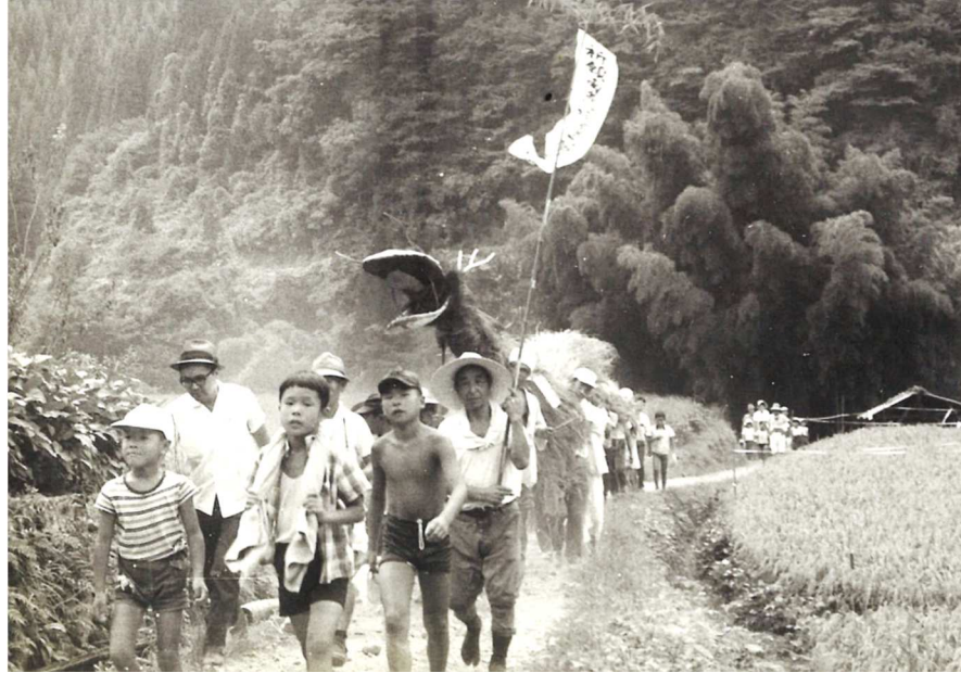
上津江公民館 電話：55-2043/FAX：55-2728