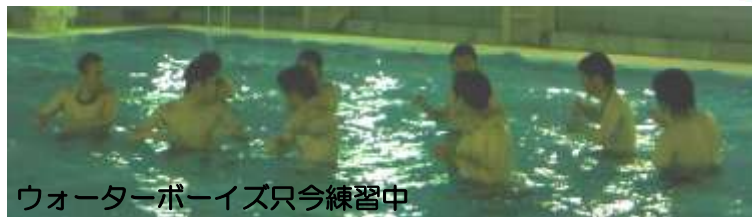
ウォーターボーイズ只今練習中

上津江の20代が中心に、OBの指導の下まだ水温の低い時期から仕事帰りに集まってコツコツ練習を続けてきました。当日は完成度の高い技を期待していますね!