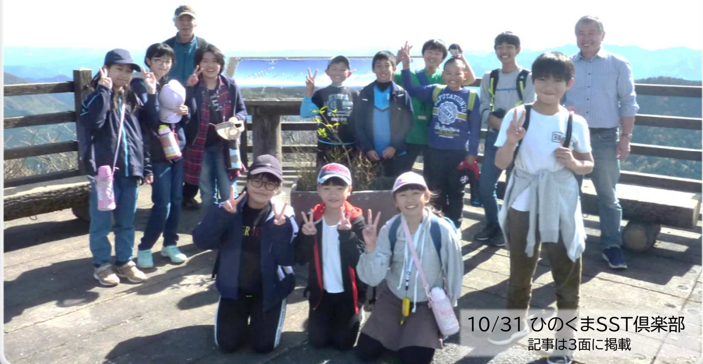
10/31 ひのくまSST倶楽部 記事は3面に掲載