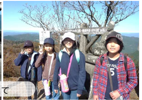
福岡県の最高峰「本釈迦」の頂上にて

続いてとなりの日田市最高峰1231mの普賢岳（釈迦岳測候所）に到着！山頂の展望台からは、由布岳、くじゅう連山、祖母山、阿蘇五岳、熊本平野、雲仙普賢岳、筑紫平野、脊振山、宝満山、英彦山、そして日田盆地と360°の大パノラマを体感することができました。雄大な景色を眺めながら日田市で一番高いところで食べるお弁当は格別のようなでした。