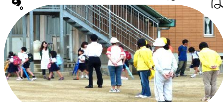
子ども達の元気なあいさつが聞こえます