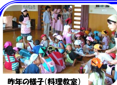
昨年の様子(料理教室)

5月28日(月)「成人セミナー」に、雨宮廣務氏(気象予報士)をお招きし、『日隈の防災心得』～災害は忘れる暇なくやってくる～と題し、自然災害についての講演をしていただきました。大雨での避難は、車では行かない車は水に弱い