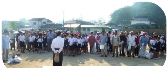
朝早くから集まって頂いた皆さん

平成24 年度の高 齢者セミ ナー『な がいき塾』 が5月28 日の「キレ イキレイ 大戦」を皮 切りに始ま りました。