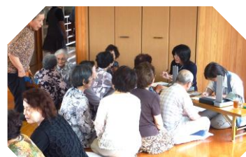
保健師さんによる健康相談

6月25日(月)、中 釣町公民館で、自治 会長・町内民生委 員・福祉委員さん方 の呼びかけで、町内の 高齢者多くの方々 が、認知症予防教室 「すずめの学校」の体 験にいらして頂きま した。