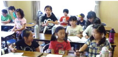
開講式(どんな体験が出来るかな?)

今年度より開催する、『ひのくまSST倶楽部』の参加募集をいたしたところ、23名の児童の皆が集まりました。活動を行う前段の6月13日には、参加児童の保護者説明会を開催しこれから、年間14講座(左表参照)の予定、参加についての諸注意などの説明会を行い、6月30日(土)に開講式・農業体験を行いました。若干定数に余裕があります。今からでも参加したい方がいらっしやいましたら日隈公民館 ☎22-6982まで連絡ください。