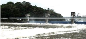
7月3日の大雨(台風の瀬)

冠水した道路では10cmのプーリーの利きが悪くなり水位が高いと車は浮いてしまい、ドアが開かなくなり外へ逃げ出せなくなることでした。