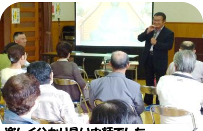
楽しく分かり易いお話でした。

6月25日(月)、中 釣町公民館で、自治 会長・町内民生委 員・福祉委員さん方 の呼びかけで、町内の 高齢者多くの方々 が、認知症予防教室 「すずめの学校」の体 験にいらして頂きま した。