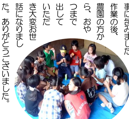
おいしいおやつを戴きました