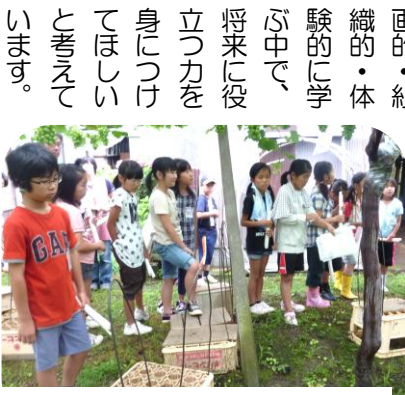
作業の手順を真剣に聞いています

公民館で行われる活動に参加し、しっかりと学んでいけば「生きる力」を団体生活での「リーダー」としての力が養われると思います。 今の時期に必要な社会的資質「わち」「礼儀」「整理整頓」「我慢強さ」「挑戦する態度」「集注力」などを計画的・組織的・体験的に学ぶ中で、将来に役立つ力を身につけてほしいと考えられています。