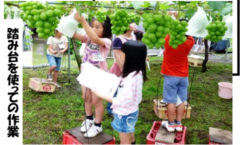
踏み台を駆使しての作業

うの肩までは少し遠く踏み台を使っ て行いました。9月には甘くて美味し い実になることを願って、一つ一つ大 事に包みました。 作業の後、 農園の方が ら、およ つまで 出して いただ き大変お世 話になりまし た。ありがとうございます。