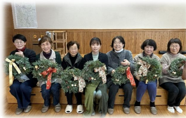
まなびのセミナー 12/16

第6講としてクリスマスリースを作りました。枝を巻いたリースの骨組みに、さつま杉やヒバ、ブルーアイスを時計回りにたくさん差し込みました。かわいいリボンで木の実を飾り、とてもボリュームのあるリースができました。