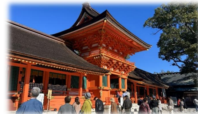
主催事業合同研修 11/30

ささ身の味噌チーズ焼きと人参とツナのマリネ、春雨スープを作りました。ささ身は筋を取ったり麺棒で叩いたりして処理が大変でしたが、手間がかかった分美味しくできあがりました。