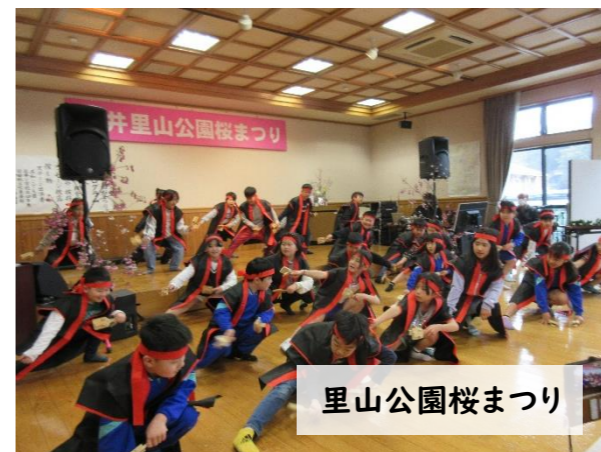
里山公園桜まつり

24日。今年も里山公園桜まつりが催されました。あいにくの雨のため、会場を当館に移しての開催でしたが、それでも多くの方が参加され盛り上がりました!晴れたら里山公園にぜひお花見へ🌸