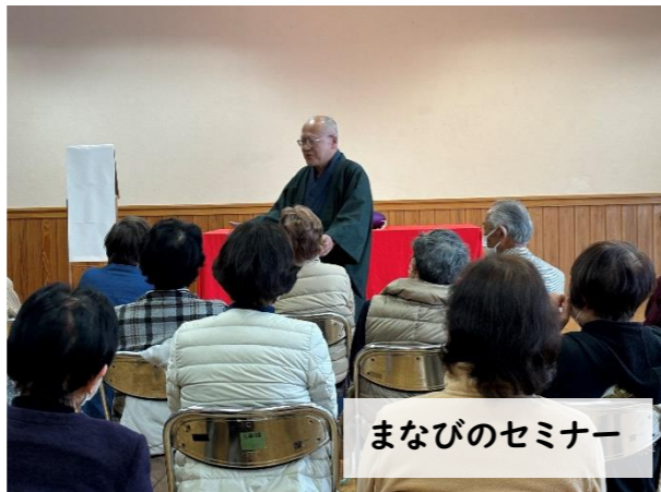
まなびのセミナー

19日。今年度最後のちびっこサロンは、ランドヤ古墳公園で遊びました。シャボン玉やボールを追いかける元気な姿に成長を感じます。こども園に行く前の思い出になれていたら嬉しいです😊