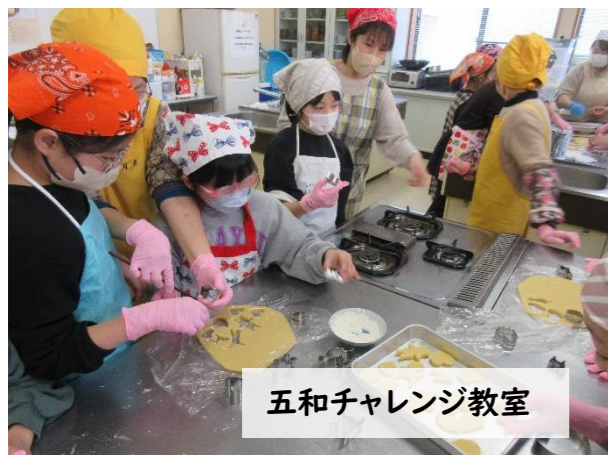
五和チャレンジ教室

9日。今年度最後はお菓子作り教室です!今回は3月にぴったりのマシュマロとクッキーを作りました。みんなでどンドン型抜きしたクッキーの焼ける美味しい匂いと笑顔で楽しい時間になりました😊