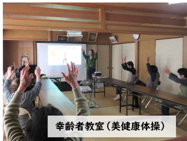
幸齢者教室(美健康体操)

9日。今年度最後はお菓子作り教室です!今回は3月にぴったりのマシュマロとクッキーを作りました。みんなでどンドン型抜きしたクッキーの焼ける美味しい匂いと笑顔で楽しい時間になりました😊