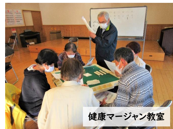
健康マージャン教室

28日。今回の五和チャレは国際交流！別府溝部学園男子バスケット部のジョンさん・アルハマドゥさんといっしょに、体育館でポートボールをして遊びました。記念撮影もして楽しい時間になりましたね📷