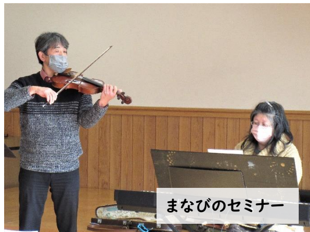
まなびのセミナー

16日。今夜のよるごはんは、ジビエ消費喚起・普及のため林業振興課さんにご提供いただいた猪肉と鹿肉を使った品々です。パイ包みやハムなど風味を活かした逸品は、何度も味わいたくなりましたね🐾