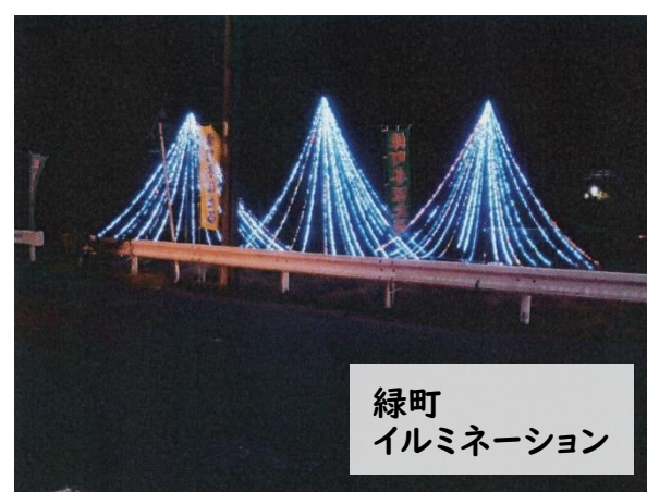
緑町 イルミネーション

今年も、緑町青壮年会さんによる「冬ほたる(イルミネーション)」が、冬の夜長を光で彩りました。 平成8年頃より約30年頑張ってくださいましたが、惜しまれつつも今年で終わりとのこと。設置作業などをふくむ過去分もあわせての掲載となっております。長らくありがとうございました🌟