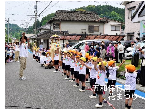
五和保育園 花まつり

10日は2年に1回の計量器定期検査でした。はかりは使用していく中で必ず誤差が出てきます。重さの正確性を保つため、しっかり検査を受けたはかりは合格証を貼って使用されています📄