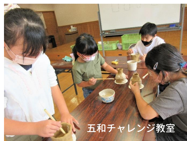
五和チャレンジ教室

27日。女性セミナーでは「自分の体を知って健康な1年を！」とわかみやコミュニティケアセンターさんをお招きしました。理学療法士さんのお話、興味深かったですね💡今年も元気に活動しましょう！