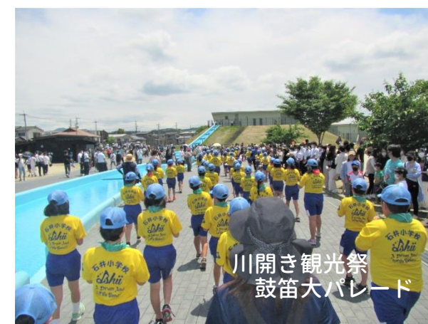
川開き観光祭 鼓笛大パレード

21日は3年ぶりの観光祭でした。もちろん鼓笛大パレードもおひさしぶり！ 石井小の子どもたちも、おそろいの黄色いユニフォームに身を包み、演奏行進を成し遂げました🎶