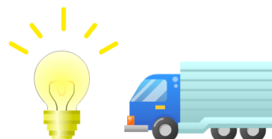
電球交換・移動販売