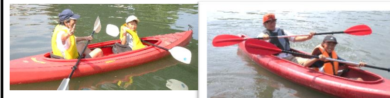
小学校3年生以下は、親子同乗！（写真上・下）