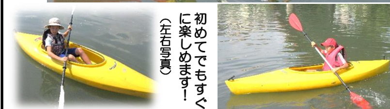
初めてでもすくなく楽しめます！（左右写真）