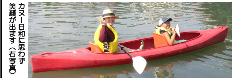
カヌー日和に思わず笑顔が出ます（右写真）