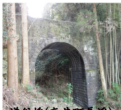
逆谷橋(高井町長溪)