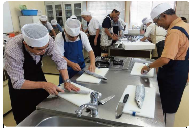
先生のお手本を真似て、太刀魚をさばっていきます。