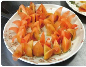
このトマトの皮の薄さ見事です!