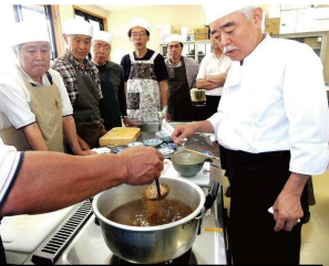
天津飯のあん具合のチェック中。みんな真剣です。