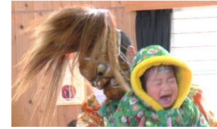
神迎神楽（上写真） 鬼の面に大泣きです！