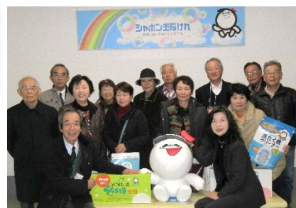
懇親を兼ねた昼食時の女性運営委員さん方のテーブル（上写真） シャボン玉石鹸工場で商品やゆるキャラといっしょに！（右写真）