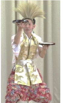
盆神楽（ほんかぐら） お米を入れた盆を手に持ち曲芸的な舞に魅せられました!!

石井町2丁目自治会主催の『邦楽の調べ』が石井小体育館で開催されました。当日は、7月5日の九州豪雨被災地域の鈴連町の皆さまをご招待して「元氣」を届けました。