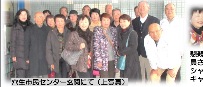
穴生市民センター玄関にて（上写真）

17年1月1日から、一枚看板化を廃止し、市民福祉センターと公民館の全てを「市民センター」に改称・統一しました。 説明後、五和公民館運営委員の皆様方から出た多くの質問に、まちづくり協議会長、副会長、公民館長さん方が丁寧にご答えて下さり、充実した研修ができました。