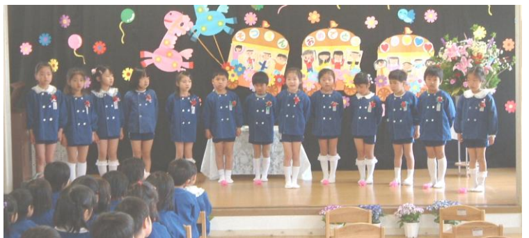
卒園の園児たち、小学校でも新しい友達をたくさん作ってください。

あさひトラック&フィールドクラブの部員たちが一番楽しみにしています卒業旅行を3月29日(火)に実施しました。 今回の研修地はスペースワールド。まずは宇宙飛行士を体験。ムーンウォーカーと呼ばれる機具を使って月面歩行を体験しました。地球の1/6の重力で歩く少しの力でフワフワと宙に舞い、歩くのに悪戦苦闘していました。終了後は自由行動とし、みんな様々なアトラクションで楽しんできました。 今回卒業する6年生3人、よくがんばりました。中学に入っても様々な事にチャレンジしてください。残ったみんなも4月からまたがんばりましょう。