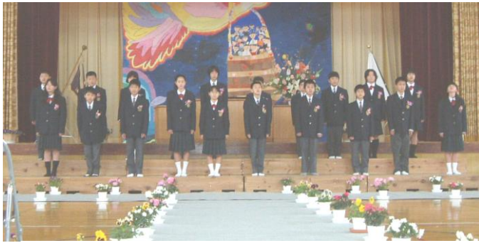
卒業生のみんな、新しい制服が似合います。

3月23日(水)に朝日小学校で、30日(水)に朝日保育所で卒業式・卒園式が行われました。 今年度は朝日小学校から20名の児童が、朝日保育所から13名の園児が卒業・卒園を迎えました。 みんな保護者や先生たち、在校生に見送られながら、小学校や保育所での思い出を胸に刻んで新たな第一歩を踏み出しました。 4月からは、それぞれ小学生・中学生になります。新しい学校でも勉強に運動、他の地区の友達との交流等にごんばってください。