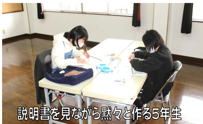
説明書を見ながら黙々と作る5年生