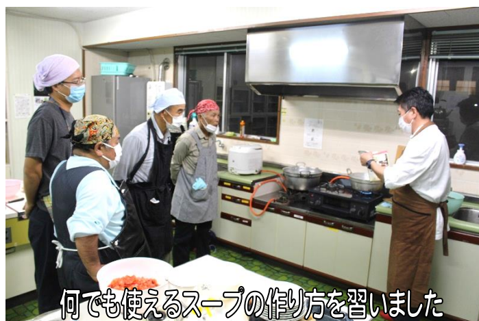
何でも使えるスープの作り方を習いました