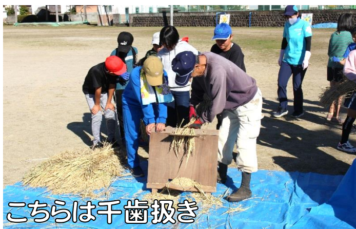
こちらは千歯扱き