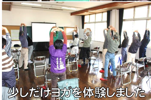
少しだけヨガを体験しました