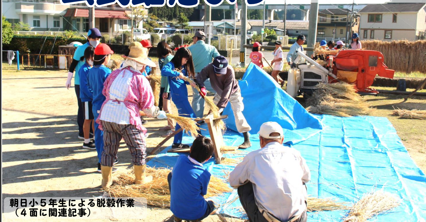
朝日小5年生による脱穀作業 (4面に関連記事)