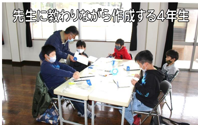
先生に教わりながら作成する4年生

初めに木星や土星などの惑星や星座の話をした後、早速ホバークラフトの作成に取り掛かりました。土台は発泡スチロールでできており、まっすぐきれいに飛ぶには、3個ある重りをどのように取り付けるかがカギとなります。バランスが悪いと、途中で曲がったり、浮き上がって落ちたりします。子ども達は先生にヒントをもらいながら、何回もテストを繰り返して、どの取付け方が一番良いか、試行錯誤していました。最終的には公民館の多目的ホールの端から端まで飛ばせる作品ができあがり、工夫の成果が出ていました。少しでも科学技術の面白さがわかったのではないのでしょうか。