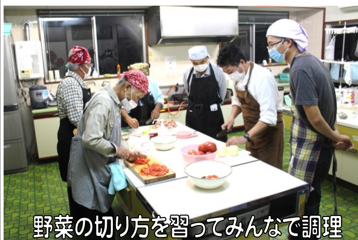
野菜の切り方を習ってみんなで調理