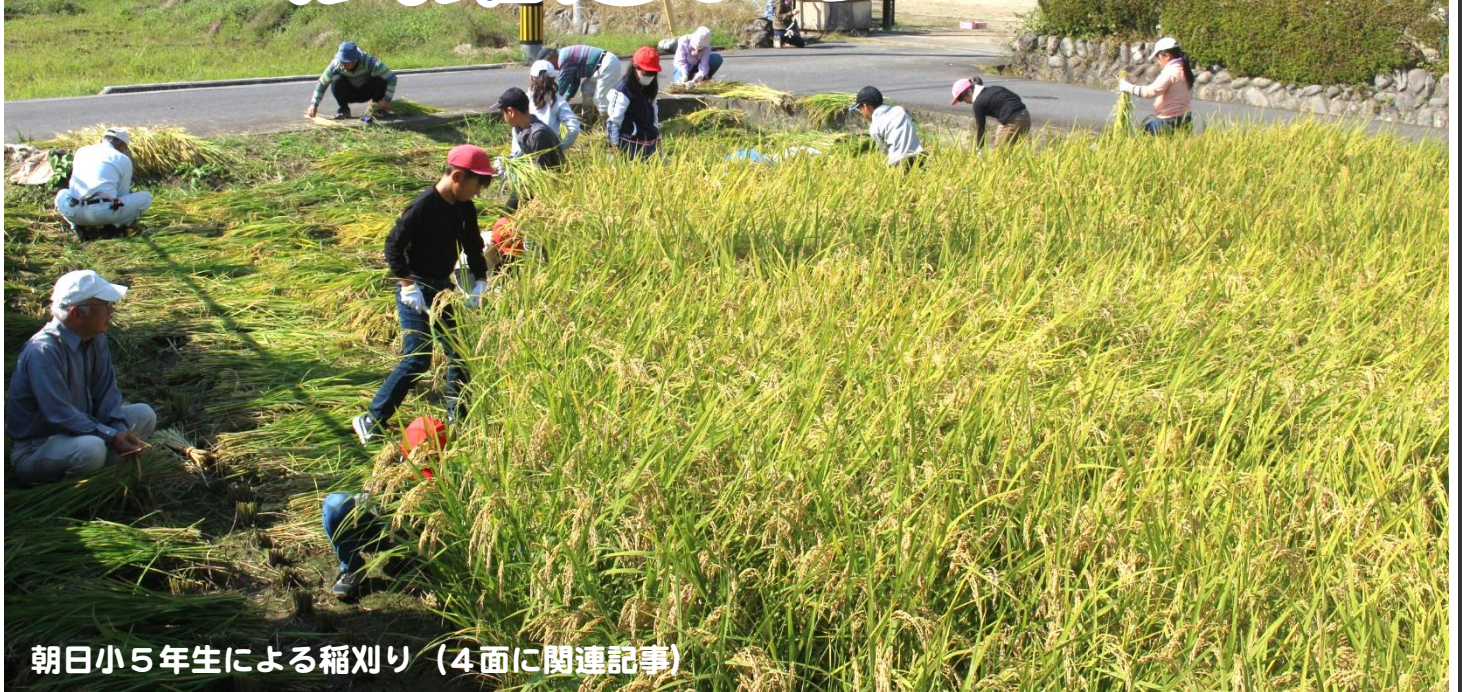
朝日小5年生による稲刈り (4面に関連記事)