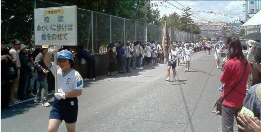
観光祭での様子、みんな一生懸命にがんばりました。