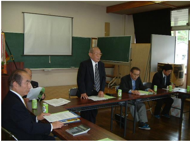
野内前会長が議長として、最後の務めをしました。

5月19日(金)、朝日公民館多目的ホールにて、平成18年度 日田市朝日公民館運営協議会 定期総会が開催され、昨年度の事業報告と会計報告、及び今年度の事業計画と予算案を提案し、全会一致で承認されました。これによりまして今年度の公民館活動が本格的にスタートすることとなりました。 会議では公民館事業について委員から青少年健全育成や成人学習等への質問や今後の問題・対応について活発な意見が交わされました。公民館では地域の皆さんの意見を、これからの公民館活動に生かしたいと思っております。