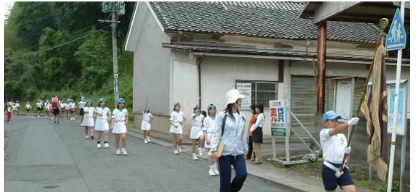
校区内パレードの様子、今年は小迫・朝日ヶ丘方面を回りました。

今年で第 59 回目を迎えた日田川開き観光祭は 5 月 20 日、21 日に盛大に行われました。朝日小学校鼓笛隊は今年も音楽大パレードに参加し、大勢の観光客の応援を受けながら堂々と行進しました。当日は天候が怪しまれましたが、快晴に恵まれ、鼓笛隊のみななはやや緊張しつつも落ち着いて演奏を行いました。今年参加した朝日小鼓笛隊の皆さん、暑いなかご苦労さまでした。来年の活躍も期待しています。